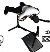
Giutar (Direct out mono)